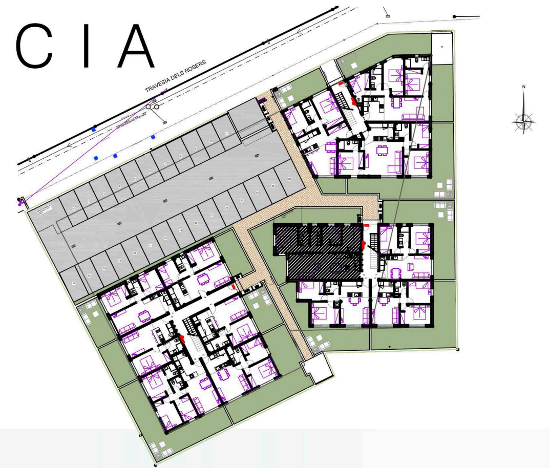
Edificio 2 - Planta Piso - Solarium Vivienda H